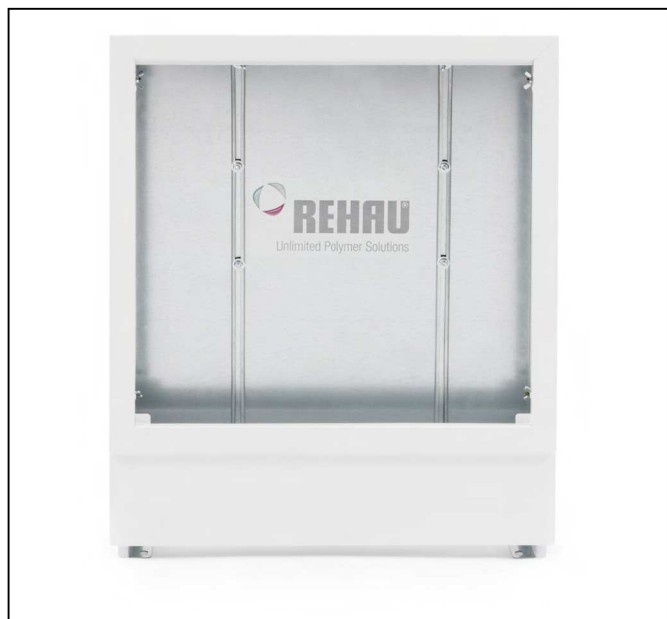
Imag. 9-19 Dulap distribuție UP (fără ușă)