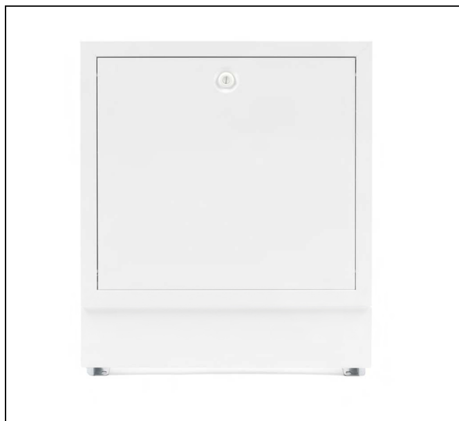
Imag. 9-20 Dulap de distribuție UP

Dulapul de distribuție UP REHAU este conceput pentru a fi montat în sistem îngropat. Poate fi reglat pe înălțime și adâncime. Pereții laterali sunt prevăzuți cu ștanțare prealabilă pentru țevi tur/retur, la alegere pe stânga sau dreapta. Facilitatea pentru schimbarea direcției este reglabilă și poate fi îndepărtată. Diafragma de obturare pentru șapă asigură o adaptare curată la suprafață. Ușa lăcuită și cadrul sunt ambalate separat. Pentru protecția față de murdărie (a carcasei dulapului de distribuție), se livrează cu o cutie de carton pentru acoperire.